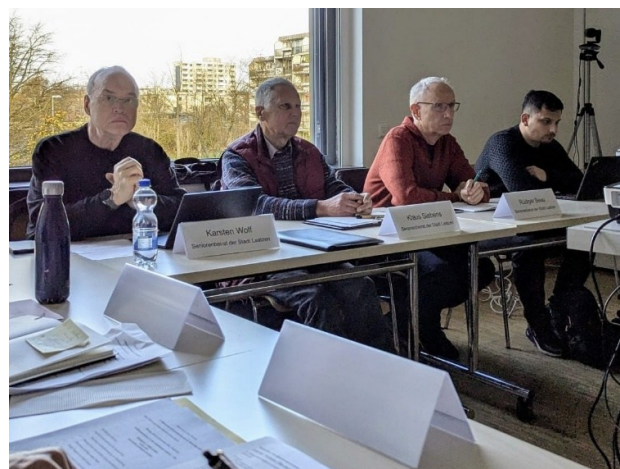
Blick in den Sitzungsraum