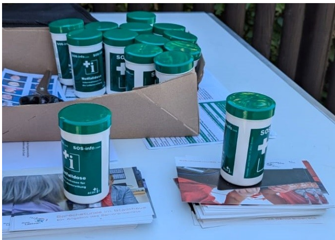
Notfalldose, Postkarte Sprechstunden, Postkarte PC-Café