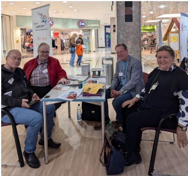
Mitglieder des Seniorenbeirats im Gespräch