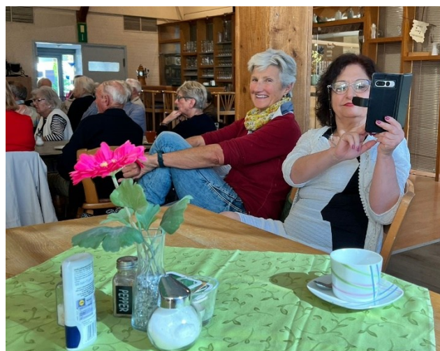
Blick in den Veranstaltungsraum