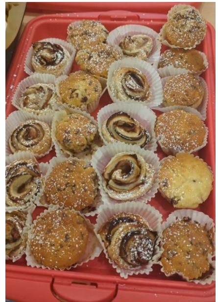
Dies und vieles mehr bot die Kaffeetafel