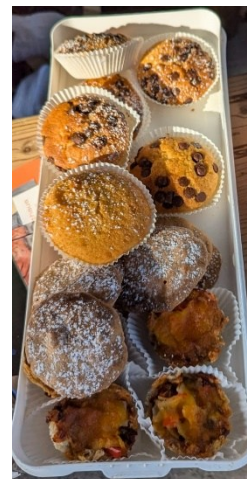
Küchlein zur Stärkung