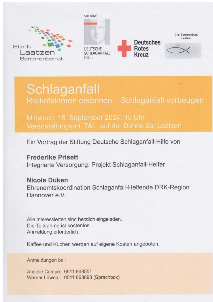
Plakat zur Veranstaltung

Die Veranstaltung von Deutschem Roten Kreuz, Christlichem Seniorenbund, Seniorenbeirat und der Stiftung Deutsche Schlaganfall Hilfe war gut besucht ein voller Erfolg.