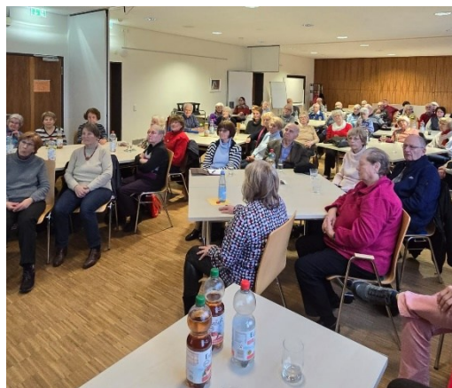
Blick in den Veranstaltungsraum.